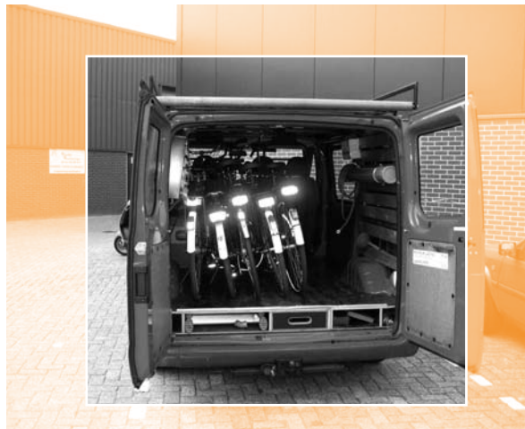
Vijf fietsen van Bureau Jeugdzorg Utrecht hebben een onderhoudsbeurt gehad en worden daar weer afgeleverd.