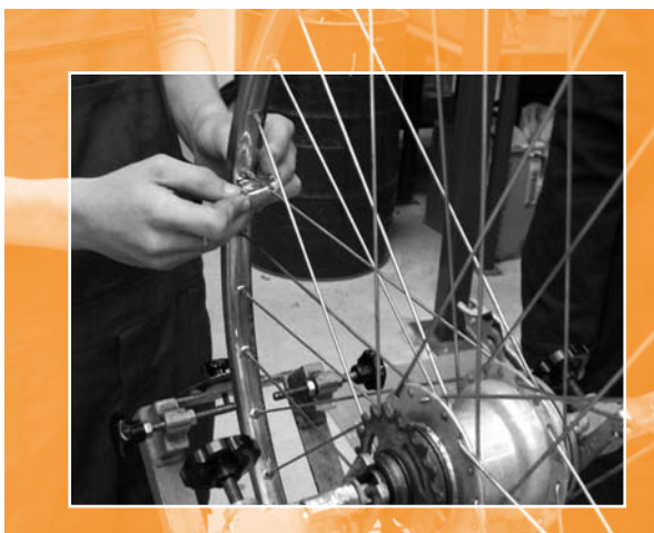
Het spaken en uitlijnen van een achterwiel.