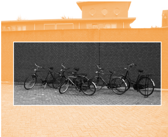
Opgeknapte fietsen gaan in de verkoop o.a. bij het Kringloopcentrum Zeist.