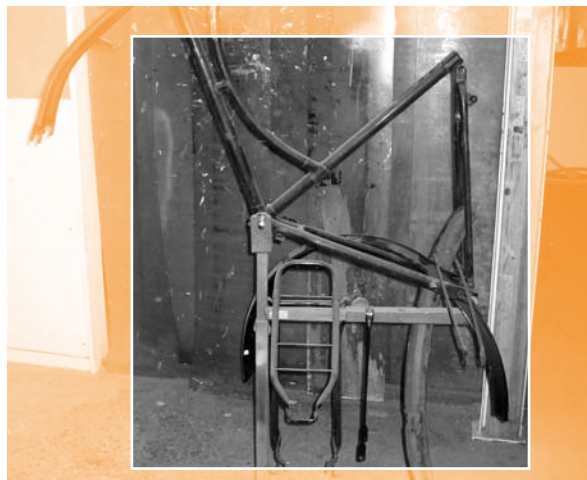
Sommige fietsen zijn voor een project in Afrika en worden daarvoor in de spuitcabine blauw gespoten.