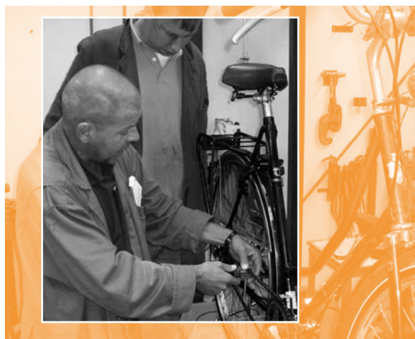
Het op maat brengen van de fietsketting.