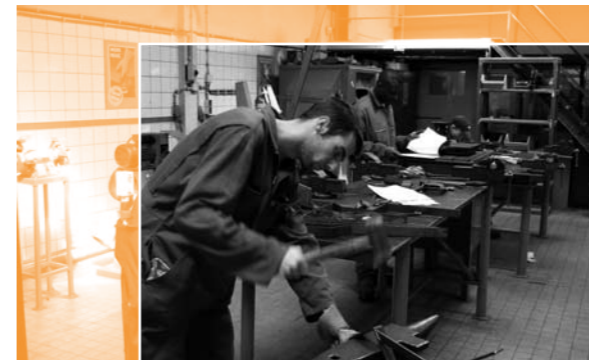
Soms is een machine niet toereikend en moeten de ouderwetse hamer en de vaste hand eraan te pas komen