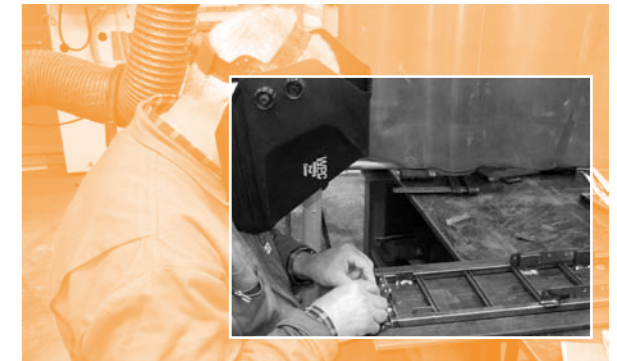
Maatwerk vereist soms ook een geoefend oog