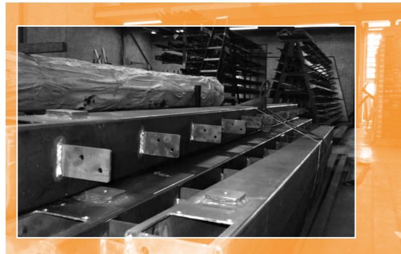
Bij Werkartaal leren de deelnemers dat ook dit soort grote, logge stalen balken precisiewerk vereisen.

Volgens Koens is niet alleen het werk-niveau belangrijk. 'Als werkgever kijken wij natuurlijk ook naar iemands